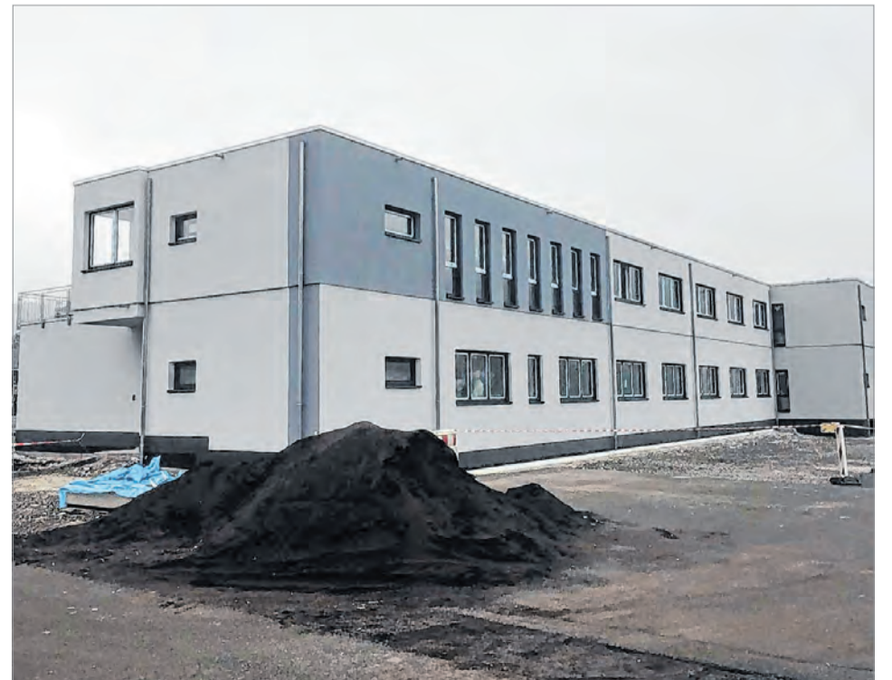
Bereits während der Bauarbeiten ließ sich erahnen, welch beeindruckendes Erscheinungsbild das neue Verwaltungsgebäude von „Fenster Blecher“ haben wird. Mit dem Ergebnis (siehe Foto auf der anderen Seite) sind alle Beteiligten hochzufrieden.

„Bewerbungen sind uns jederzeit erwünscht“, stellten alle Verantwortlichen klar. Das nagelneue Verwaltungsgebäude an der Industriestraße in Bad Laasphe dürfte für den qualifizierten Nachwuchs ein weiteres schlagendes Argument für eine berufliche Zukunft bei dem Wittgensteiner Unternehmen zu sehen.