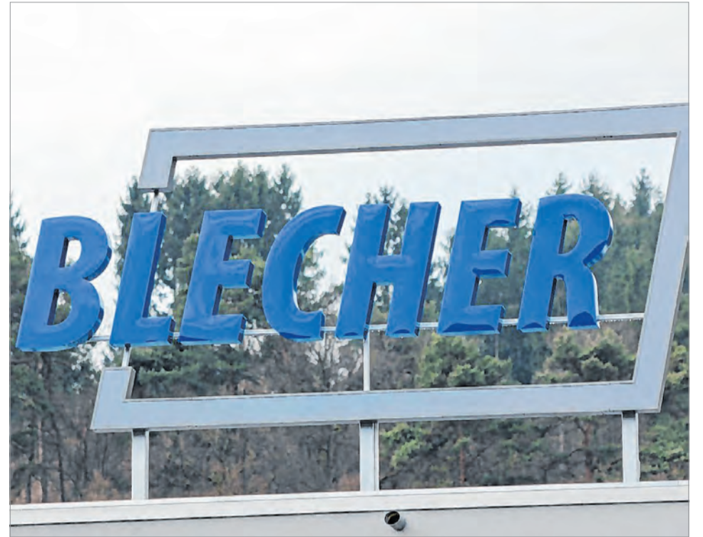
Die Strahlkraft von „Fenster Blecher“ soll auch den qualifizierten Nachwuchs erreichen – und den Fachkräftemangel entsprechend kompensieren.