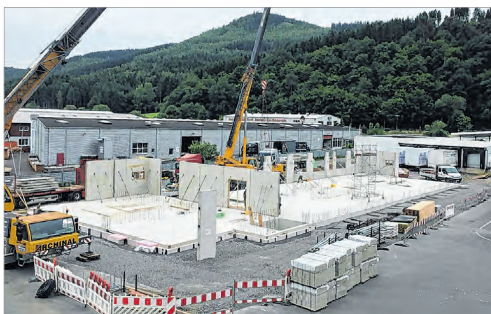
Dabei fing vor einigem Monaten alles einmal ganz klein an: Unser Foto wurde zu Beginn der Bauarbeiten aufgenommen – unter dem Strich lief alles glatt.