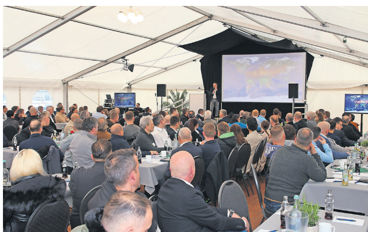
Bei dem Händlertag machten sich über 200 Kunden und Lieferanten auf den Weg zur Otto Blecher GmbH nach Bad Laasphe.

neben interessanten Vorträgen zum Thema Klimawandel und Recycling, auch nachhaltige Kundenbindungssysteme mit Hilfe digitaler Lösungen sowie Innovationen und Produktneheiten in der Beschlagtechnik vorgestellt. Ebenso fanden auch Werksbesichtigungen und Workshops mit den Firmenpartnern Aug. Winkhaus GmbH & Co. KG, Digital Building Solutions GmbH, dpi Türdesign GmbH, Energy Glas GmbH, Roll-tec GmbH, SCHMIDT GmbH und VEKA AG statt.